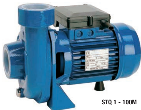
STQ 1 - 100M